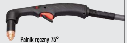
Palnik ręczny 75°

(więcej opcji palników można znaleźć w witrynie www.hypertherm.com )