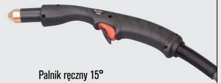
Palnik ręczny 15°