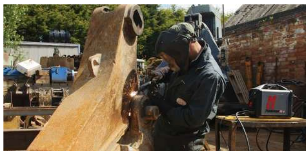
Serwis i naprawa