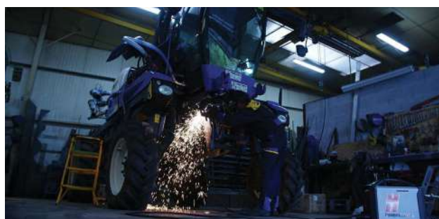
Serwis sprzętu rolniczego