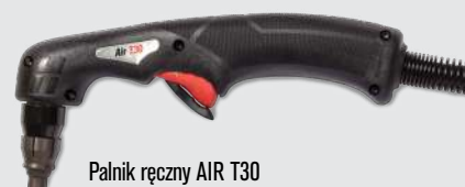
Palnik ręczny AIR T30