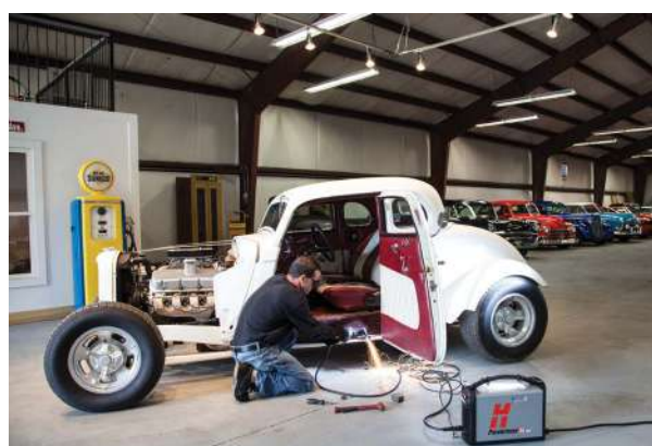
Naprawy i modyfikacje pojazdów